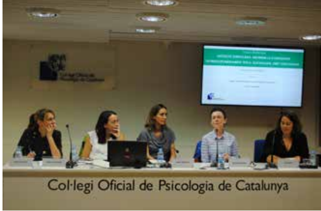
Col·legi Oficial de Psicologia de Catalunya